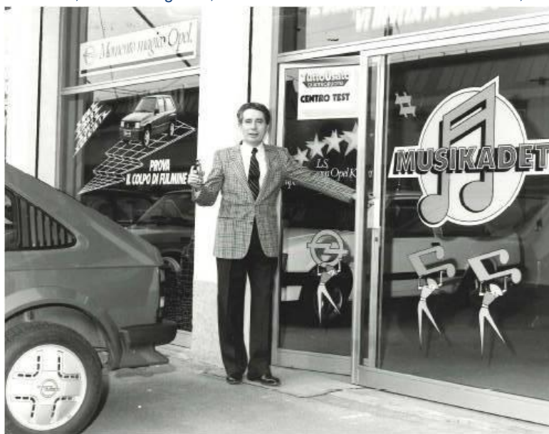
Davanti ad uno degli 11 saloni della Saigarage SpA, durante il 'mitico' concorso musikadett, il primo 'porte aperte', 1981

Nella propria vita privata, sposandone la figlia, è diventato genero di Giuseppe Luraghi - ha sempre tenuto a dire che lui è entrato in Alfa Romeo nel 1955, prima di Luraghi - e custodisce un grande archivio di famiglia, contenente importanti documenti, anche fotografici, di vita aziendale della casa del biscione,