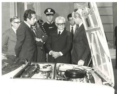
Con il Presidente Giovanni Leone

che ha sempre condiviso con Club, Associazioni ed appassionati Alfisti di tutte le generazioni.